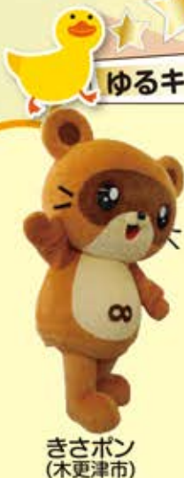
きさポン (木更津市)