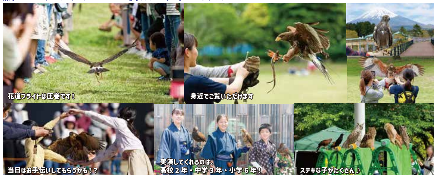
花道フライトは圧巻です!